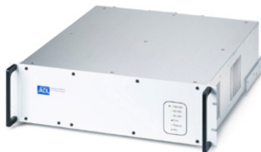
Passives Frontpanel mit LEDs

Die luftgekühlten DC-Stromversorgungen der Serie GS 60 – GS 150 gibt es in drei Varianten: mit aktivem Frontpanel, mit passivem Frontpanel und mit Status-LEDs. Die Stromversorgungen können mit voller Ausgangsleistung ohne Einschränkung der Einschaltdauer betrieben werden. Der Parallelbetrieb mehrerer Geräte ist möglich. Die Serie GS 60 – GS 150 verfügt, wie alle Stromversorgungen von ADL, über eine extrem schnelle, automatische Arc-Löschung. Die Bedienung der Geräte ist sehr einfach und sicher.