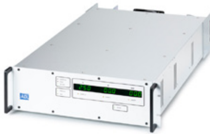
GSW mit passivem Frontpanel