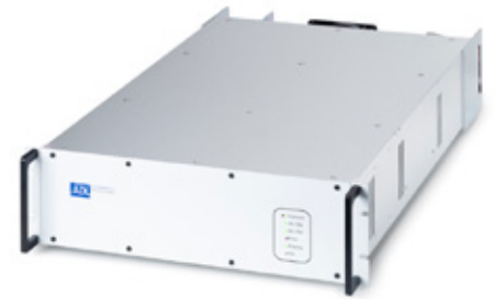
GSW mit Status-LEDs