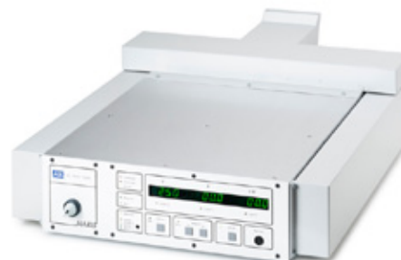
GSW mit Luftleitgehäuse

Die Ausgangsleistung kann im Parallelbetrieb bis auf 240 kW gesteigert werden. Mit einem speziellen Schaltungskonzept kann auf eine „Master-Slave-Verdrahtung“ verzichtet werden. Eine leistungsfähige Wasserkühlung sorgt auch in nicht klimatisierten Räumen für höchste Zuverlässigkeit. Die Geräte können manuell über ein aktives Frontpanel oder über eine Schnittstelle betrieben werden. Es stehen verschiedene Varianten für Frontpanels und Schnittstellen zur Verfügung. Das extrem schnelle Arc-Handling arbeitet vollautomatisch und passt sich den jeweiligen Prozessbedingungen optimal an.