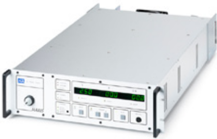
GSW mit aktivem Frontpanel