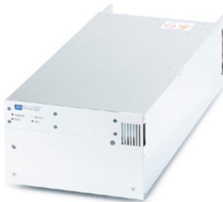
GX mit Status-LEDs