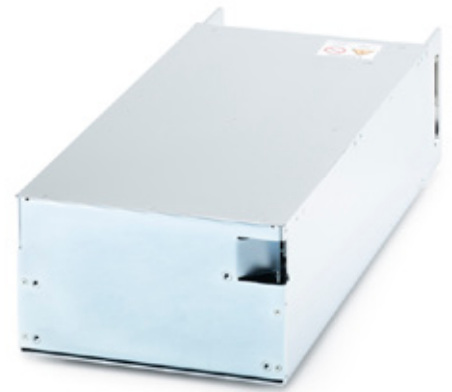
GX mit Blindgehäuse