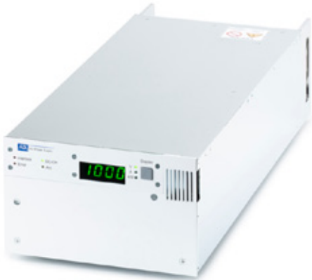
GX mit Display