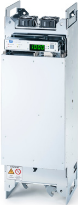
HX in senkrechter Position mit schwenkbarem Display