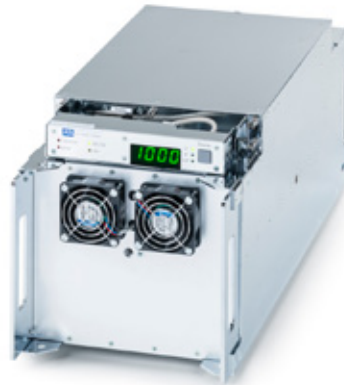
HX in horizontaler Position mit schwenkbarem Display