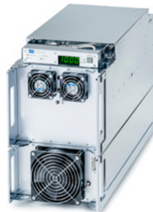
Kombination DC und AC – HX mit Unipolar Pulsgenerator

Das äußerst kompakte Design von 1/2 19" Breite und 5 HE ist speziell für Produktionsanlagen entwickelt worden, bei denen auf Schaltschränke verzichtet werden soll. Die HX verfügt über Befestigungslaschen und kann in beliebiger Einbaulage direkt in die Anlagen integriert werden. Das Display ist schwenkbar und kann vom Gerät getrennt werden. Eine leistungsfähige Wasserkühlung sorgt auch in nicht klimatisierten Räumen für höchste Zuverlässigkeit. Zur Vermeidung von Kondenswasser kann ein externes Magnetventil über die integrierte Temperatursteuerung angeschlossen werden. Die Ausgangsleistung kann im Parallelbetrieb bis auf 280 kW gesteigert werden. Das spezielle Schaltungskonzept erlaubt sowohl einen Master-Slave-Betrieb, als auch eine Parallelansteuerung über Interface Combiner oder direkt über die SPS-Steuerung. Das extrem schnelle Arc-Handling arbeitet vollautomatisch, so dass keine Parameter eingestellt werden müssen.