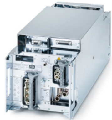
HX in horizontaler Position, Rückansicht