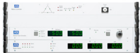
Mains Controller MC 8 und Pulsgenerator Display PD 1 Master Display MD 4

Der Mittelfrequenz / Bipolar Pulsgenerator HXB 900 – HXB 1400 vereint große Leistungen, kompaktes Design und schnelle Arc-Löschung in einem stabilen Schaltschrank. Dieser Bipolar Pulsgenerator ist auf reaktive Beschichtungsprozesse für Kathoden bis 4 Metern Länge geeignet. Die automatische Symmetrierung der Kathodenleistung und der Leistungsquotientenregler für asymmetrische Pulsleistung (bis 10 : 90 %) optimiert die Schichtgüte und verlängert die Targetlebensdauer. Der Generator erfasst alle relevanten Prozessparameter automatisch und passt seine Arc-Löschung ständig an. Für die Inbetriebnahme oder einen Targetwechsel müssen keine Einstellungen per Hand vorgenommen werden. Eine leistungsfähige Wasserkühlung sorgt auch in nicht klimatisierter Umgebung für höchste Zuverlässigkeit.