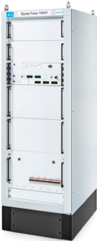
Schaltschrank - Frontansicht