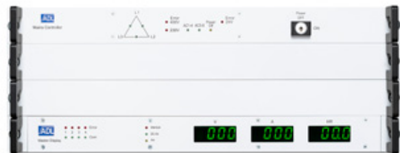
Mains Controller MC 8 und

Die HXD 901 – HXD 1401 ist eine komfortable Lösung, die hohe Leistungen, einfache Handhabung und stabile Prozesse vereint. Die Unipolar Pulsgeneratoren wurden für reaktive Beschichtungsprozesse für Kathoden bis 4 Metern Länge optimiert. Der Generator erfasst alle relevanten Prozessparameter automatisch und passt seine Arc-Erkennung und den Löschvorgang ständig an. Für die Inbetriebnahme oder einen Targetwechsel müssen keine Einstellungen per Hand vorgenommen werden. Eine leistungsfähige Wasserkühlung sorgt auch in nicht klimatisierter Umgebung für höchste Zuverlässigkeit.