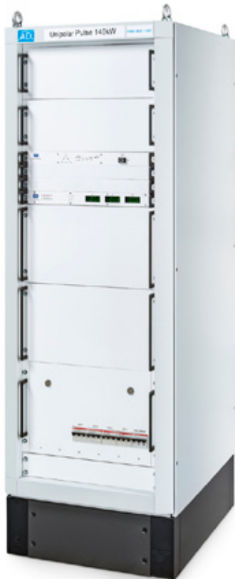
Schaltschrank - Frontansicht

Die HXD 901 – HXD 1401 ist eine komfortable Lösung, die hohe Leistungen, einfache Handhabung und stabile Prozesse vereint. Die Unipolar Pulsgeneratoren wurden für reaktive Beschichtungsprozesse für Kathoden bis 4 Metern Länge optimiert. Der Generator erfasst alle relevanten Prozessparameter automatisch und passt seine Arc-Erkennung und den Löschvorgang ständig an. Für die Inbetriebnahme oder einen Targetwechsel müssen keine Einstellungen per Hand vorgenommen werden. Eine leistungsfähige Wasserkühlung sorgt auch in nicht klimatisierter Umgebung für höchste Zuverlässigkeit.