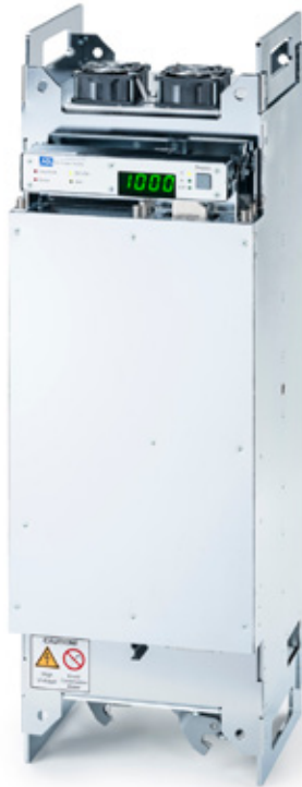
HXF in senkrechter Position mit schwenkbarem Display